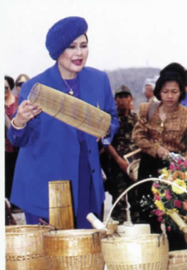
ปก : สมเด็จพระนางเจ้าสิริกิติ์ พระบรมราชินีนาถ พระบรมราชชนนีพันปีหลวง

๖๘ กฎหมายน่ารู้ : กฎหมายบัตรประชาชน ๒๕๖๕